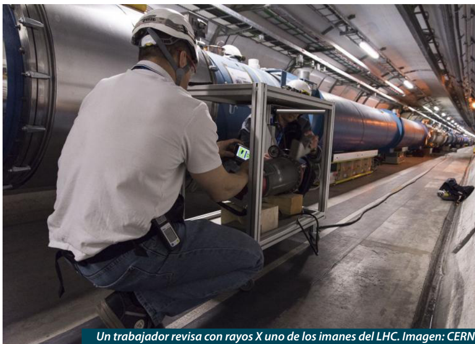
Un trabajador revisa con rayos X uno de los imanes del LHC.